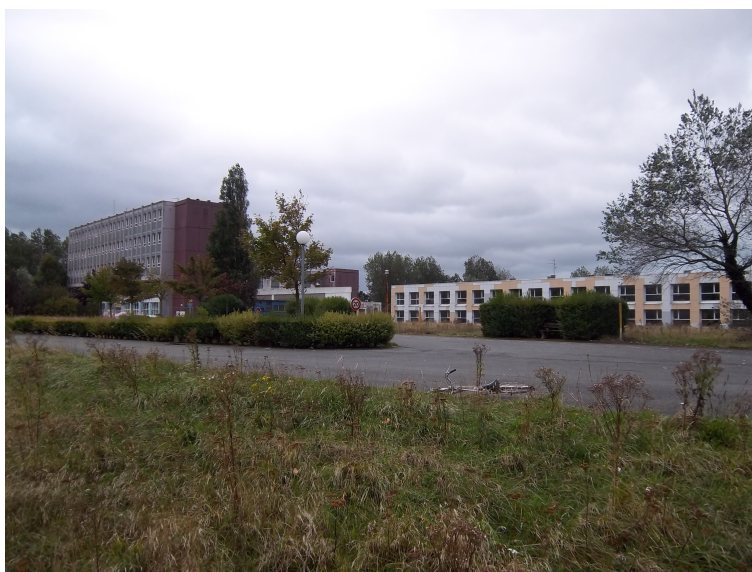
Bâtiment dont le désamiantage est prévu en 2013 – 2014 (3 et 4 sur le plan)