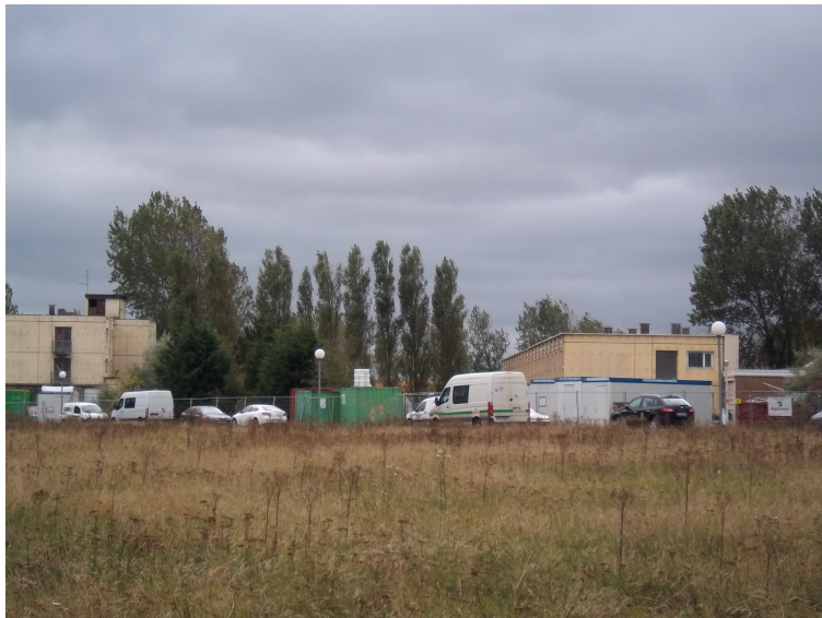
Vue des bâtiments en cours de désamiantage (1 et 2 sur le plan)